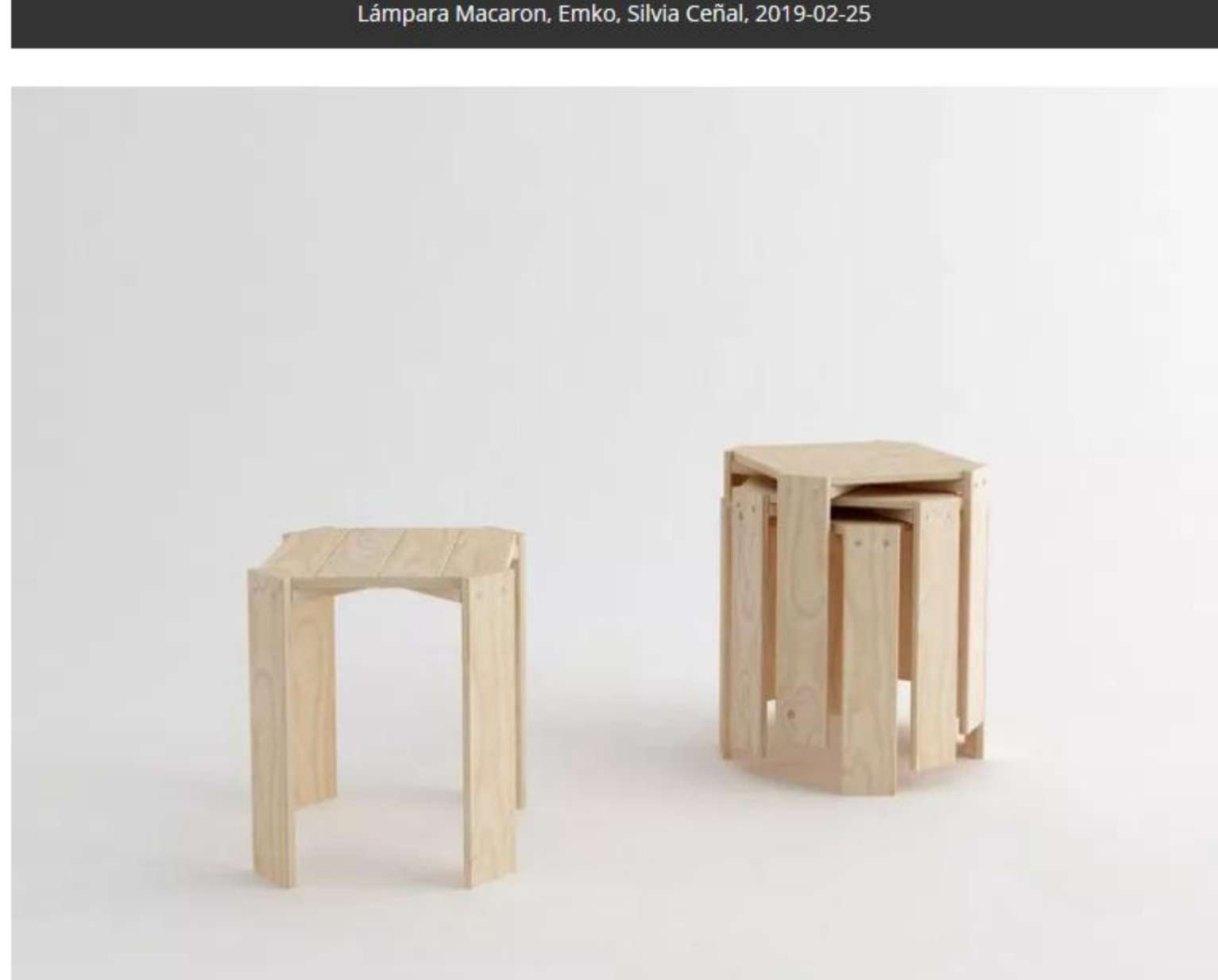
Taburete Lau, Lufe, Silvia Ceñal, 2019