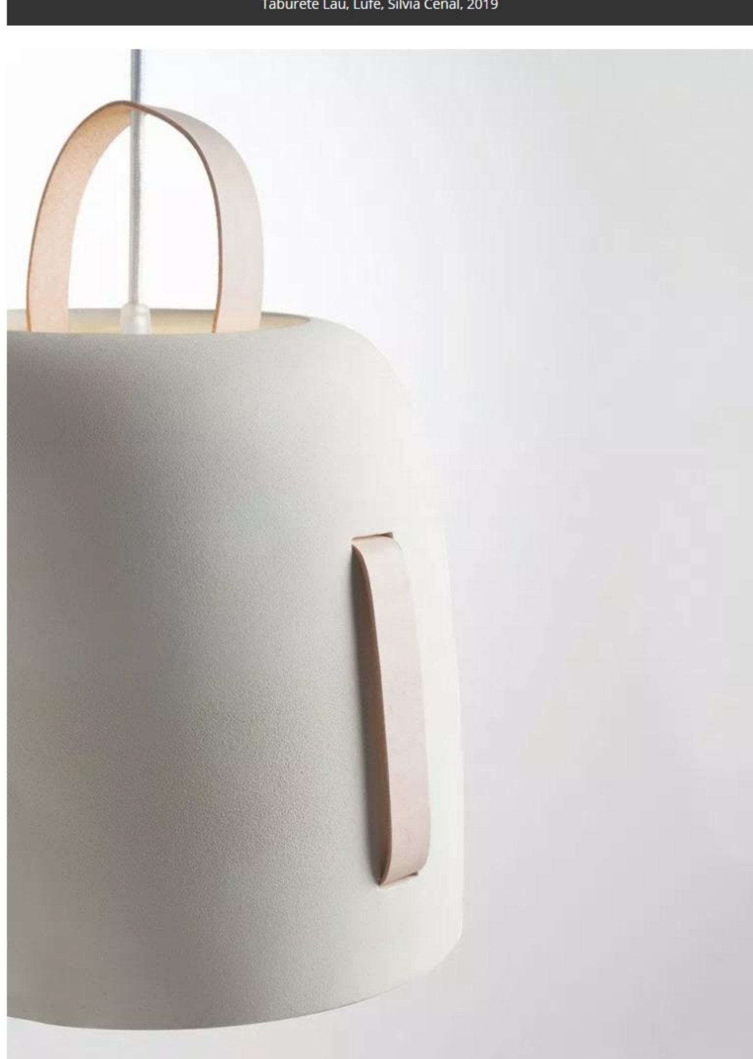
Lámpara Cowbell, Plussmi, Silvia Ceñal, 2019

Tags: diseñadora, diseño, entrevista, iluminación, mobiliario, San Sebastián, Silvia Ceñal