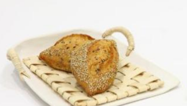
Foto: Diseño vasco Ohi. Quesera y panera Bi

A continuación, repasamos algunas de las reinterpretaciones contemporáneas de diseño vasco propuestas por Ohi y la curiosa tradición artesanal que las inspira y origina su terminología.