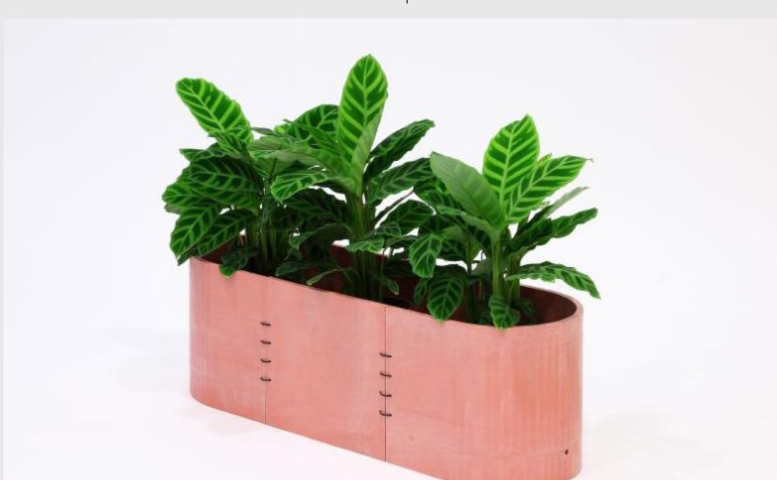
Maceta modular Lolo

Foto superior: Diseño vasco Ohi. Salvamanteles Su