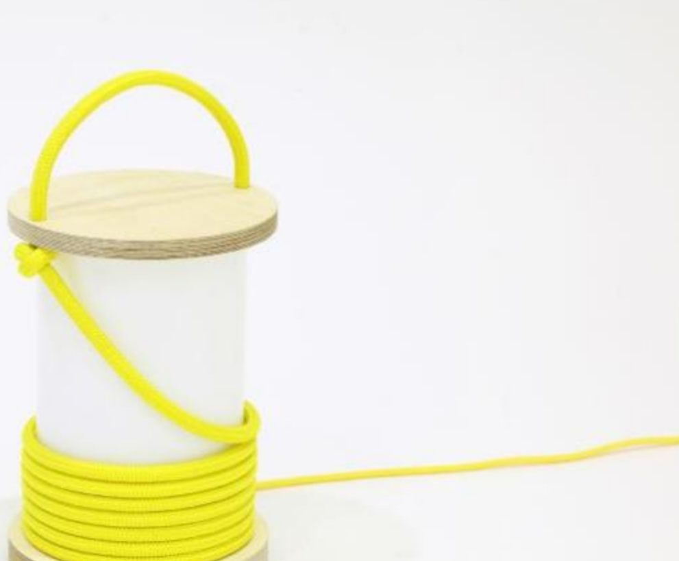
Lámpara Argizaiola