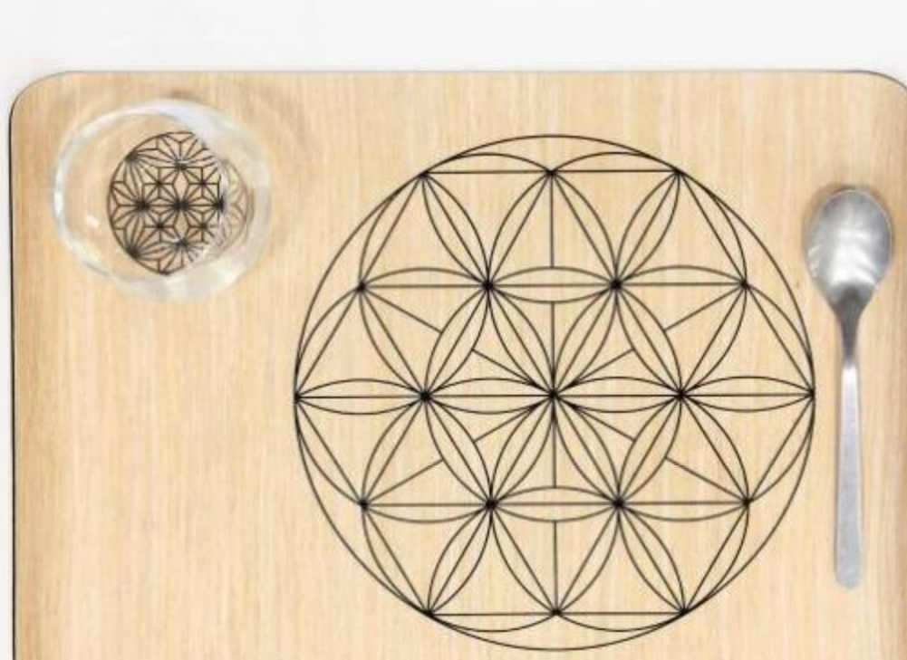
Bandeja Eguzki

En la pieza Ogi , la artesanía adquiere un rol protagonista a modo de técnica sobre soporte textil . La pieza se compone de dos grandes bolsillos donde guardar las barras de pan que antiguamente se colgaban en la puerta de las casas. En ellos se ha estampado un motivo ornamental, descontextualizado a la medida y características de la pieza, muy habitual en objetos como la argizaiola o la kutxa. Se trata de una muesca hecha con una gubia de tallar que ha sido geometrizada, llevada a la mínima expresión y a la que se ha aumentando la escala, creando un pattern que reinterpreta el estampado original sobre madera.