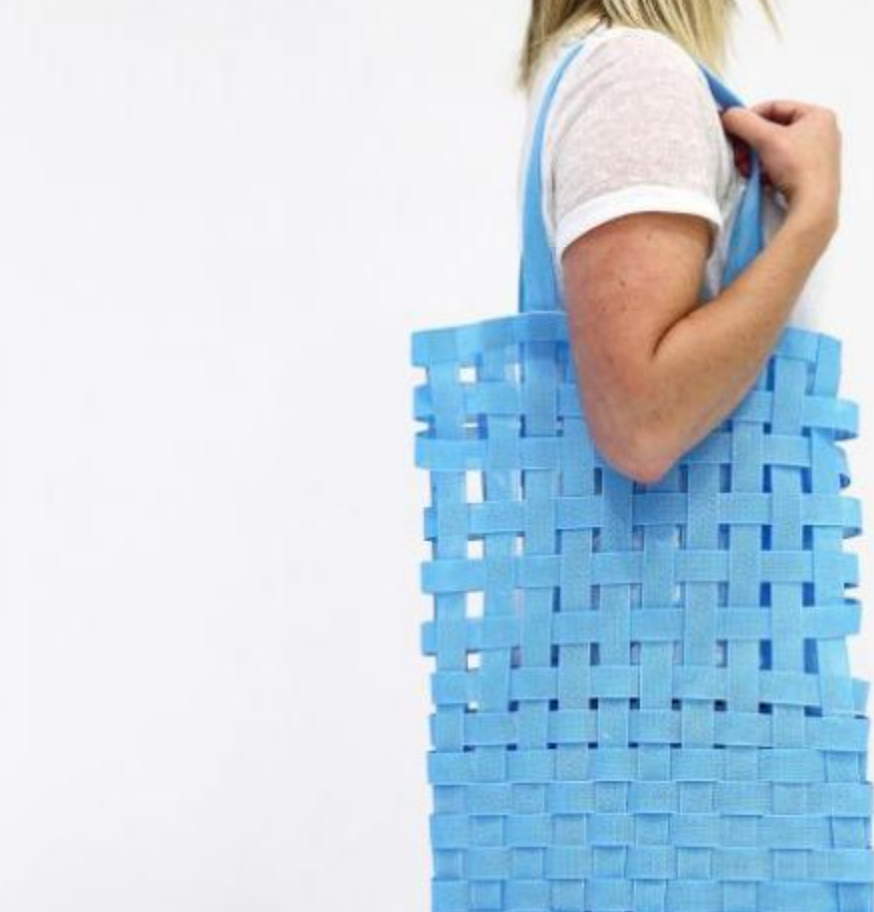
Foto: Diseño vasco Ohi. Bolsa Saski