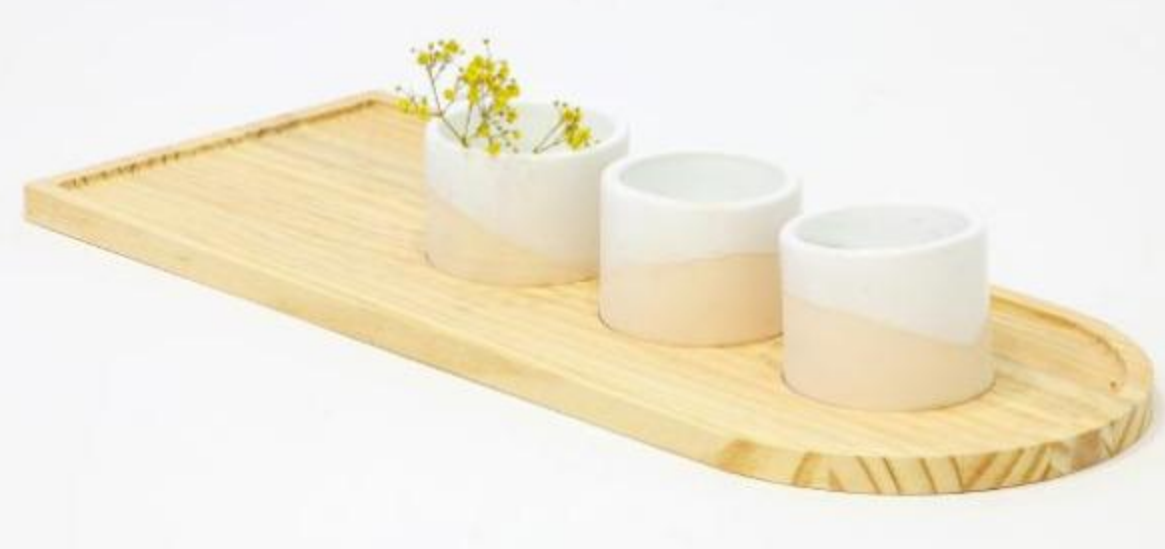
Foto: Diseño vasco Ohi. Bandeja Hiru

Haciendo referencia a las grapas del lañado, se han creado dos módulos básicos unidos mediante bridas que conforman una maceta modular de largo variable. Dentro de la propia pieza, se han incluido los sistemas de almacenamiento y salida del agua, así como se ha fabricado un prototipo impreso en 3D color terracota imitando el color del barro rojo.