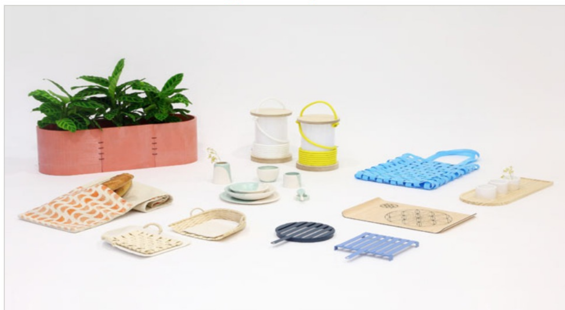
Colección "Ohi Design Project". Foto cortesía de Ohi Design Project