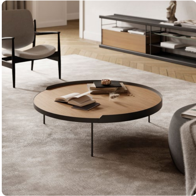
Mesa de centro Gau Treku