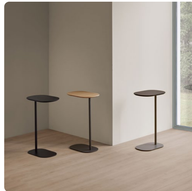
Mesa auxiliar Une Kendo