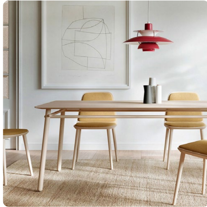
Mesa Basoa Treku