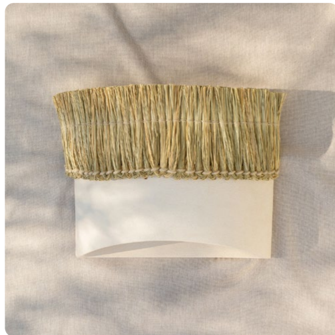
ZestaPunta Proyecto personal