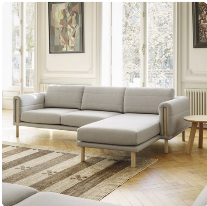
Colección Abric Bosc