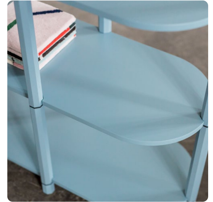
Estantería Octo Viruna