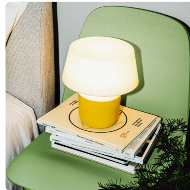
Colección Drops Gantri