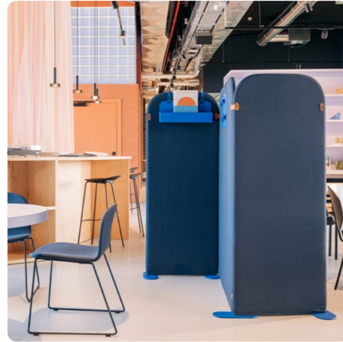
Separador Ola Ondarreta